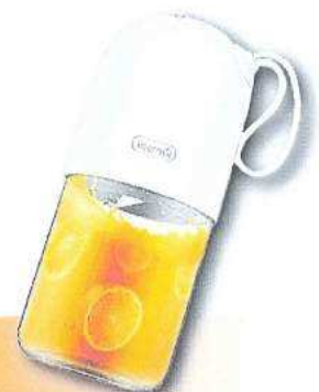
(จำนวนจำกัด)

หมายเหตุ : รายได้ไม่เกิน 25,000 บาท ปีที่ 6 เป็นต้นไป ลูกค้า สวัสดิการ = *MRR - 1.00% ต่อปี / รายได้ > 25,000 = *MRR - 0.75% ต่อปี / ซื้องานประกัน = *MRR รายได้ > 25,000 บาท ปีที่ 4 เป็นต้นไป ลูกค้า สวัสดิการ = *MRR - 1.00% ต่อปี / รายได้ > 25,000 = *MRR - 0.50% ต่อปี จัดถูกประเมินสินเชื่อฟรี วงเงินในโครงการจำนวนจำกัด เงื่อนไขอื่น ๆ โปรดอ่านระเบียบธนาคาร อัตราดอกเบี้ยลอยตัว *MRR = 6.150% ต่อปี ประกาศ ณ วันที่ 25 พ.ค. 63