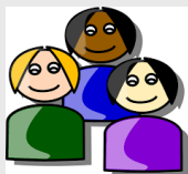
ผู้กู้ยืม