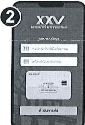
ใช้เลขบัตรประชาชน และรหัสลับบัตรประชาชน