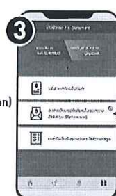
เลือกเมนู "ขอรับใบแจ้งยอดทางอีเมล (e-Statement)"