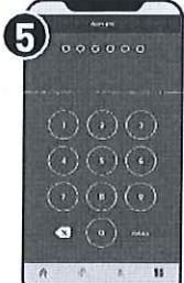
กำหนดรหัสผ่าน 6 หลัก