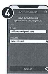
ตรวจสอบอีเมล และเบอร์มือถือ