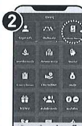
เลือกเมนู "ดาวน์โหลด e-Statement"