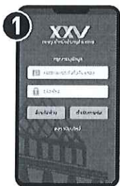
กด "ลงทะเบียน"