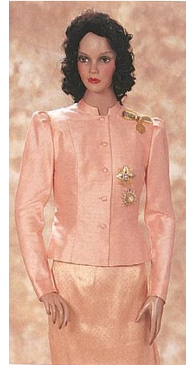
ชุดไทยครึ่งยศ