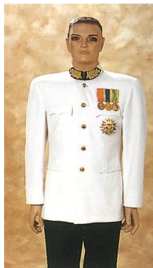
ชุดขอเฝ้าครึ่งยศ