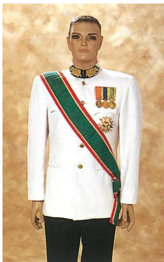
ชุดขอเฝ้าเต็มยศ

โดยมีวิธีการประดับเครื่องราชอิสริยาภรณ์เช่นเดียวกับหน้า ๔ - ๑๕ ถึง ๔ - ๑๗