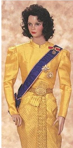
ชุดไทยเต็มยศ

โดยมีวิธีการประดับเครื่องราชอิสริยาภรณ์เช่นเดียวกับหน้า ๔ - ๑๘ ถึง ๔ - ๒๑