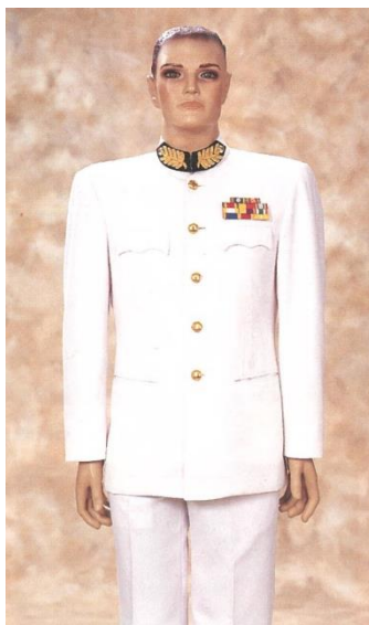
ชุดขอเฝ้าปกติขาว