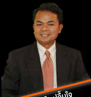
คุณเตโซ ปลื้มใจ