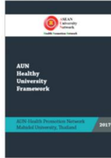
AUN Healthy University Framework