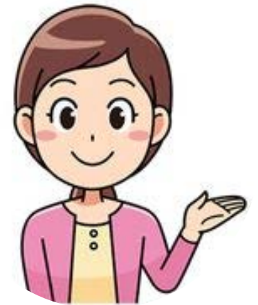
อาจารย์สาธิต เชี่ยวชาญพิเศษ

ดำรงตำแหน่ง อาจารย์สาธิตชำนาญการพิเศษ และปฏิบัติหน้าที่มาแล้ว ไม่น้อยกว่า 3 ปี