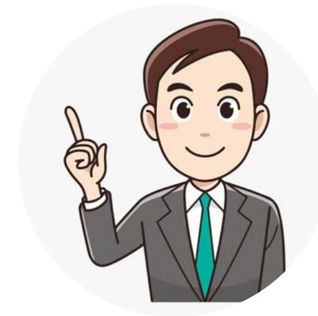
อาจารย์สาธิต เชี่ยวชาญ

ดำรงตำแหน่ง อาจารย์สาธิตชำนาญการ และปฏิบัติหน้าที่มาแล้ว ไม่น้อยกว่า 4 ปี