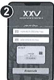
ใช้สิทธิบัตรประชาชน และรหัสลับบัตรประชาชน