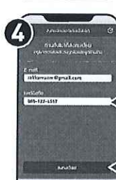
ตรวจสอบอีเมล และเบอร์มือถือ