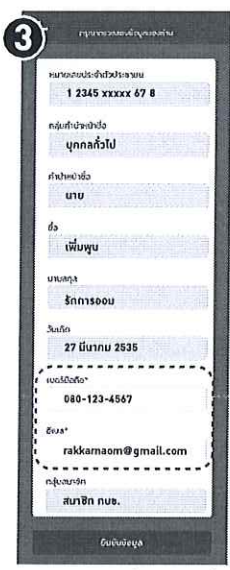
ตรวจสอบความถูกต้องและครบถ้วน