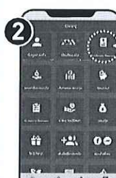
เลือกเมนู "ดาวน์โหลด e-Statement"